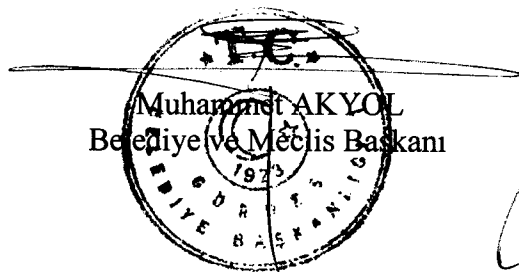
Muharrem AKYOL Belediye Meclis Başkanı

KARAR NO 97: 2020 yılı Ekim Ayı 2. Birleşim Meclis Toplantısının, 08 Ekim 2020 Perşembe günü saat 16:00’da Belediye Kültür Sarayında yapılmasına oy birliği ile karar verildi.